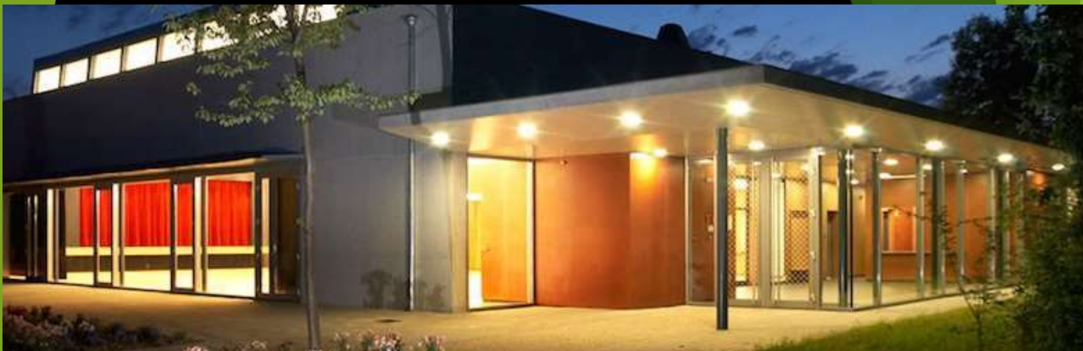
Salle des Fêtes Schoenau